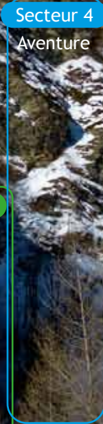
Secteur 4 Aventure