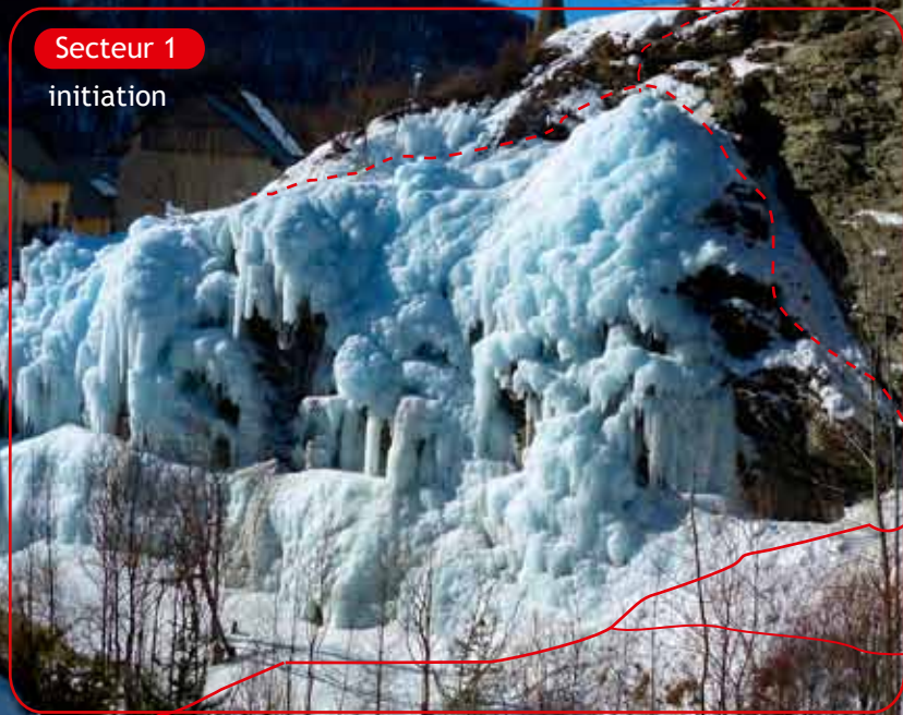
Secteur 1 initiation