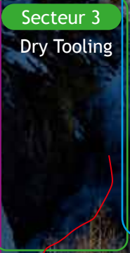
Secteur 3 Dry Tooling