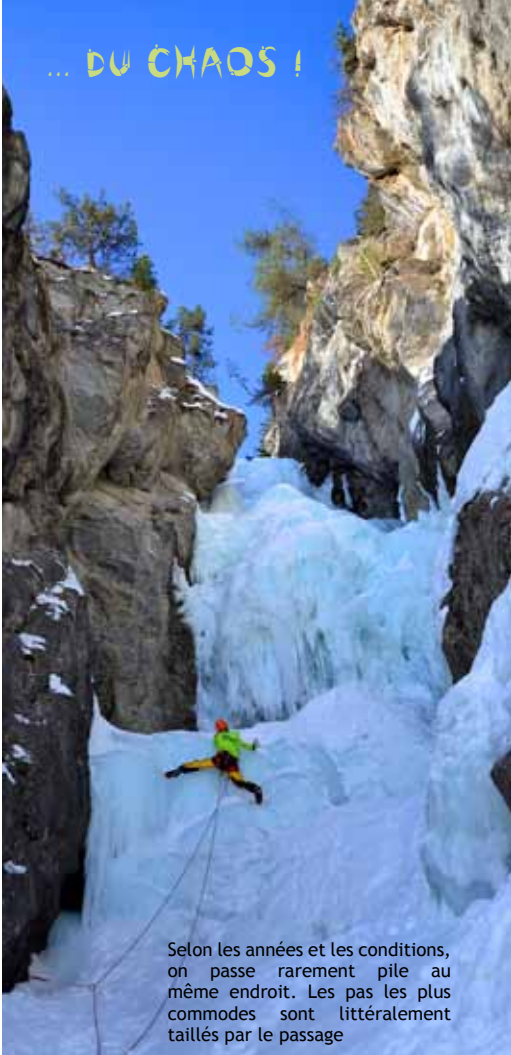
Selon les années et les conditions, on passe rarement pile au même endroit. Les pas les plus commodes sont littéralement taillés par le passage