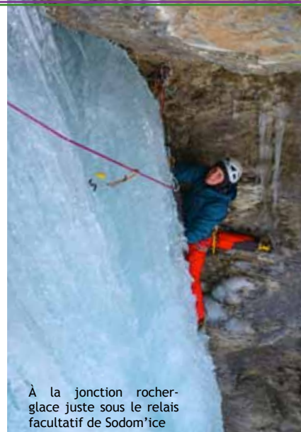
À la jonction rocher- glace juste sous le relais facultatif de Sodom'ice