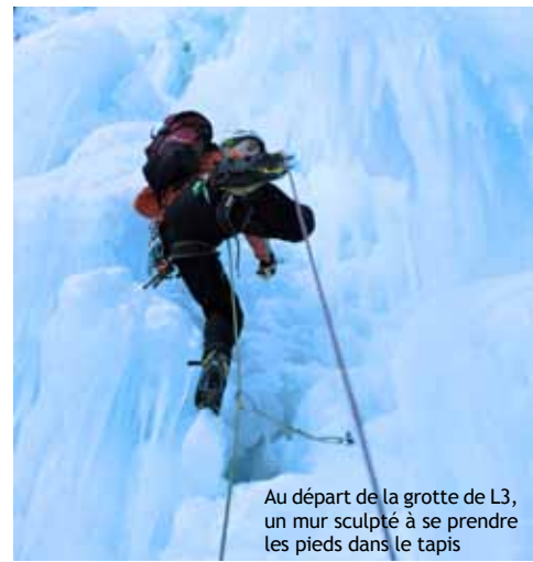
Au départ de la grotte de L3, un mur sculpté à se prendre les pieds dans le tapis