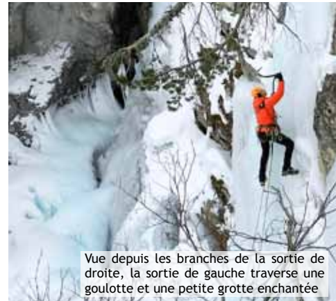
Vue depuis les branches de la sortie de droite, la sortie de gauche traverse une goulotte et une petite grotte enchantée