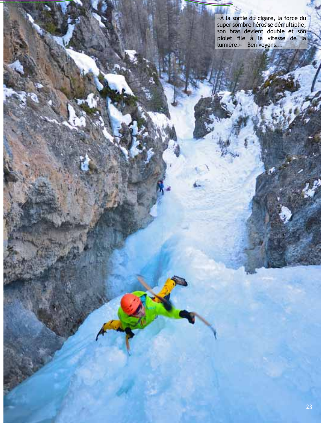
«À la sortie du cigare, la force du super sombre héros se démultiplie, son bras devient double et son piolet file à la vitesse de la lumière.» Ben voyons...