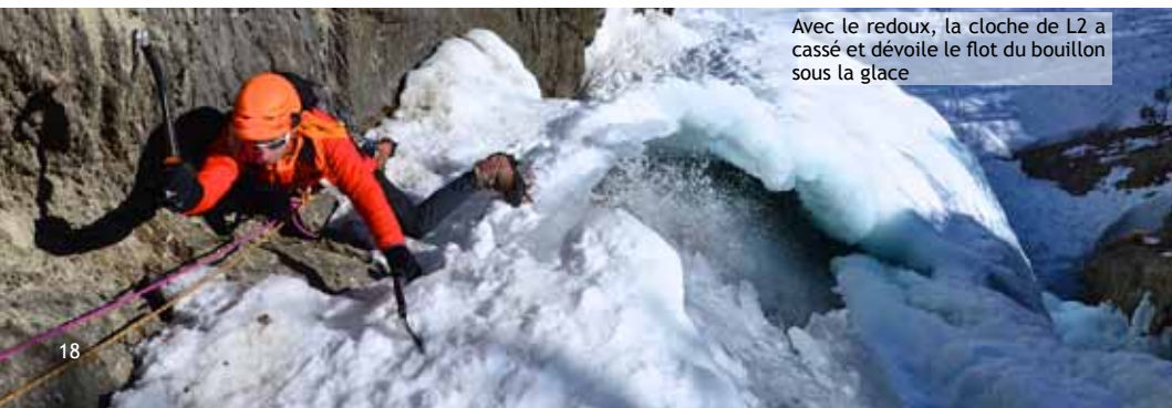
Avec le redoux, la cloche de L2 a cassé et dévoile le flot du bouillon sous la glace