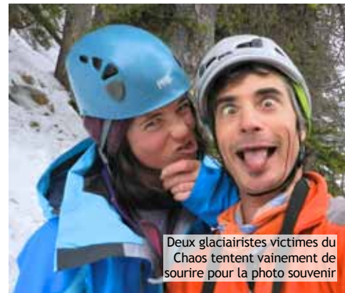
Deux glaciairistes victimes du Chaos tentent vainement de sourire pour la photo souvenir