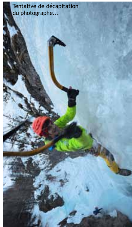
Tentative de décapitation du photographe...